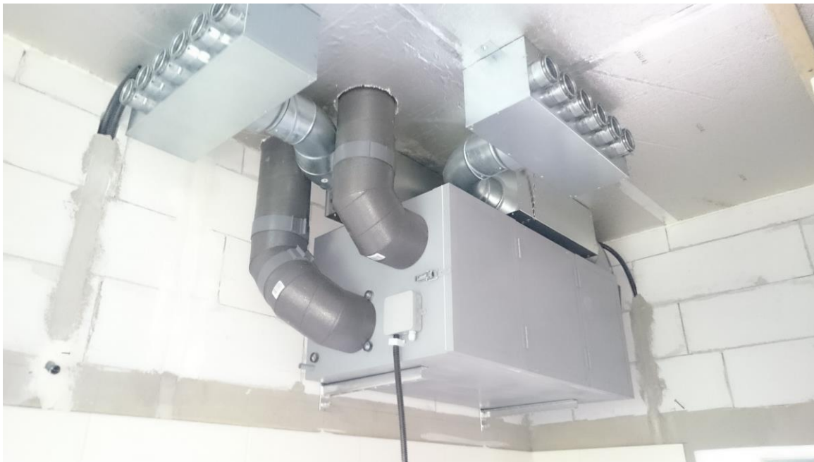
2. ábra Szellőztető gép a mennyezetre szerelve, EPP beszívó/kidobó ággal. A „házfelőli” oldalon 1-1 db hangcsillapító, vízszintesen a gép felett, majd 1-1 db befúvó és elszívó osztódoboz.

Több szintes vagy többlakásos épület esetén a szellőztető gépet igyekezzünk a rendszer középpontjához közel tenni (pl. kétemeletes épületnél ne a pincébe, stb.)!